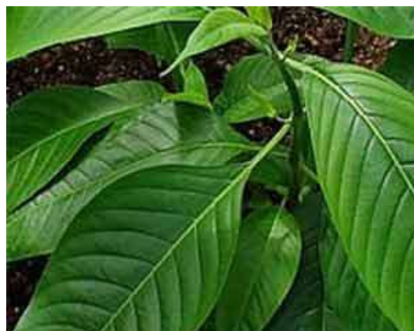
Figure 2. Adathoda vasica twig

like fever, expectorant, inflammatory, plies, asthma, skin diseases, cough, cold etc., (Table 1) In the present results the importance of the rural curative plant insight have been observed. Apart from efforts are insolvent to educate the supplementary generations about their magnitude, it may be misplaced in future. This diversity of information might donate accurately in contemporary drug devious or in government policies to encroachment contemporary novel drug invent systems in rural origin areas, and in the enrichment of advance formulations with reference to rural curative medicinal important pant.