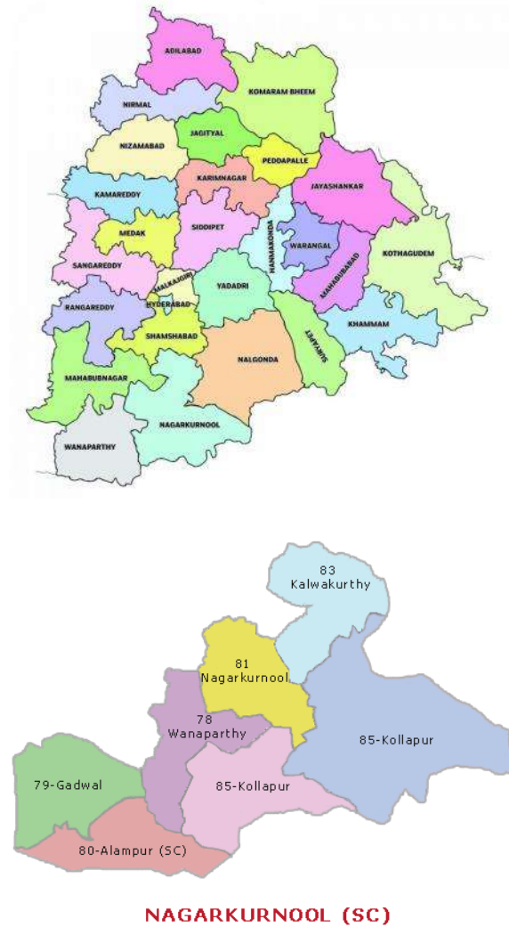
Figure 1. Specific Study area Nagarkurnool District, Telangana State, India.

inflammatory activity (Chakraborty, 2008) and Adhatoda vasica was traditionally used by midwives at the time of delivery because of its uterotonic activity. Due to its anti-implantation activity, adhatoda should not be used while pregnant (Gupta AP 1978).