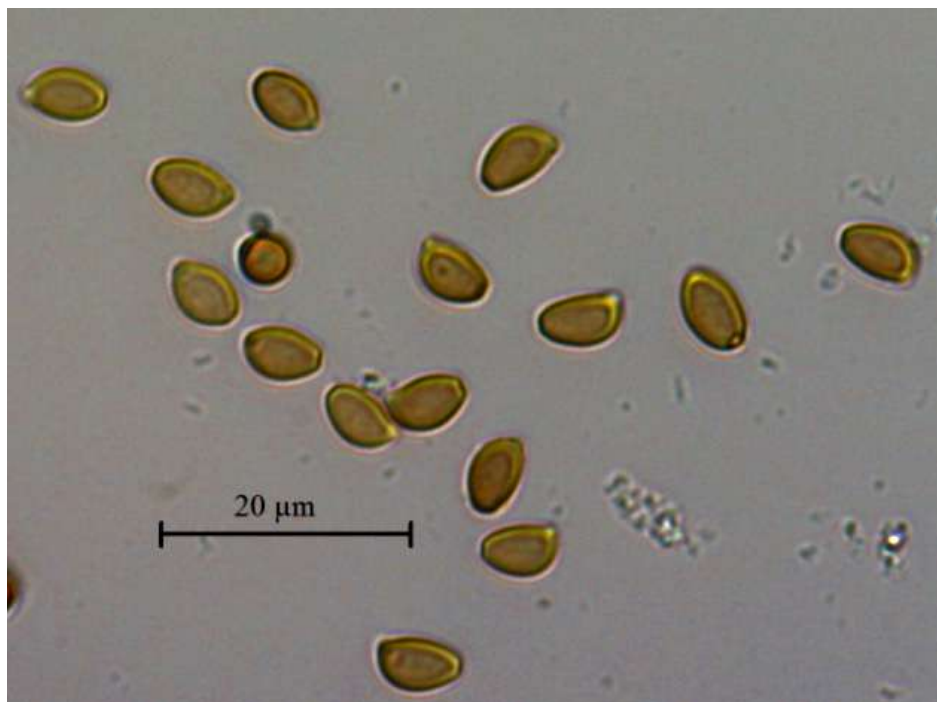
Figure 4: Clarkeinda trachodes . Basidiospores