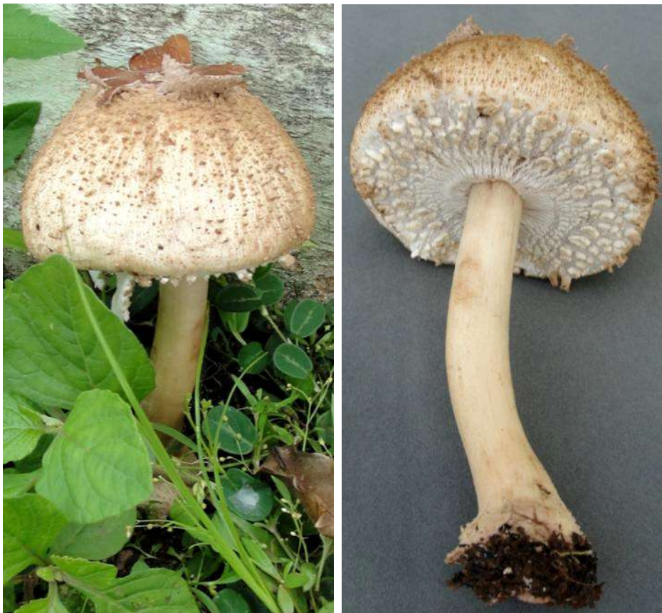
Figures 1-2: Clarkeinda trachodes . (1) Habit (2) complete fruit body showing details of pileus and hymenial surfaces

Yang, Z.L. (1991). Clarkeinda trachodes , an agaric new to China. Acta Botanica Yunnanica 13(3): 279–282.