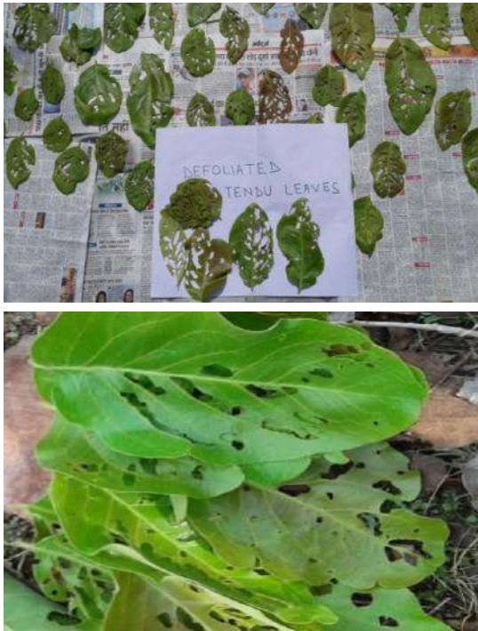
चित्र 1: तेन्दू पत्तों में निस्पत्रक-स्केराबिड बीटल का प्रकोप