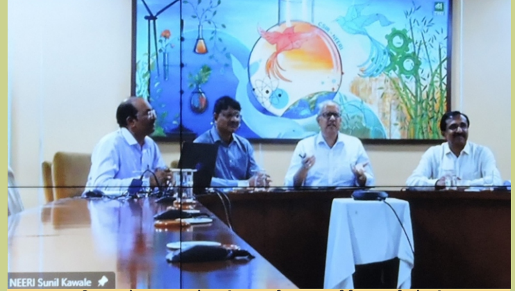
भा.वा.अ.शि.प., देहरादून और सीएसआईआर-एनईईआरआई के बीच एक समझौता ज्ञापन पर हस्ताक्षर किए गए