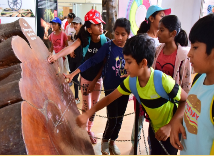
वैलिगंट्स एकेडमी, कनकपुरा रोड, बेंगलुरु के 03 शिक्षकों के साथ ग्रेड V और VI के छात्रों ने भा.वा.अ.शि.प.-का.वि.प्रौ.सं., बेंगलुरु का दौरा किया