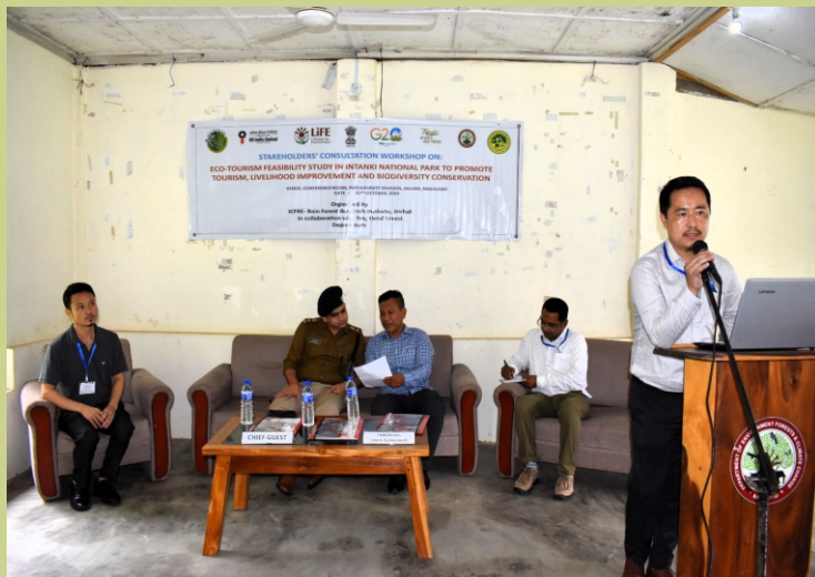
भा.वा.अ.शि.प.-व.व.अ.सं., जोरहाट द्वारा इंटान्की राष्ट्रीय उद्यान में पारि-पर्यटन व्यवहार्यता अध्ययन पर एक कार्यशाला आयोजित की गई