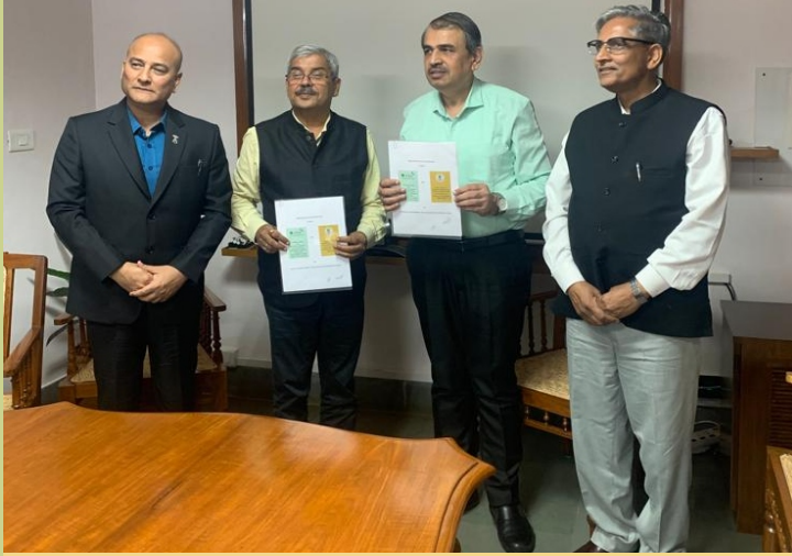
भा.वा.अ.शि.प.-का.वि.प्रौ.सं., बेंगलुरु और एनसीबीएस, बेंगलुरु के बीच समझौता ज्ञापन पर हस्ताक्षर किए गए