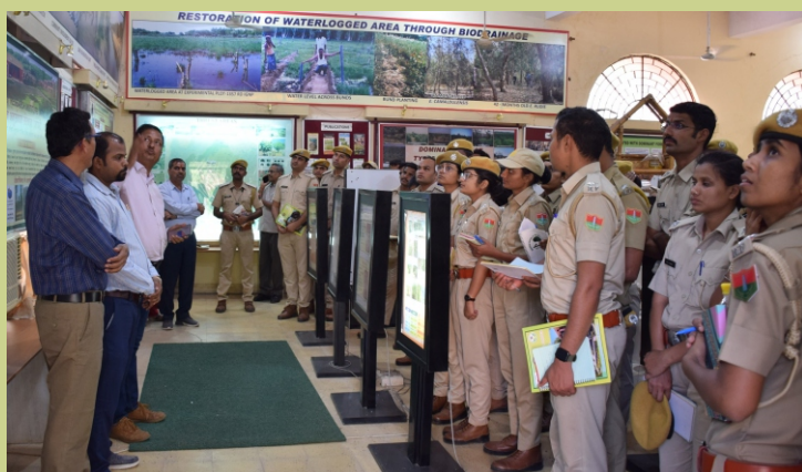
वन विभाग, जोधपुर के वनपाल प्रशिक्षुओं ने भा.वा.अ.शि.प.-शु.व.अ.सं., जोधपुर का दौरा किया