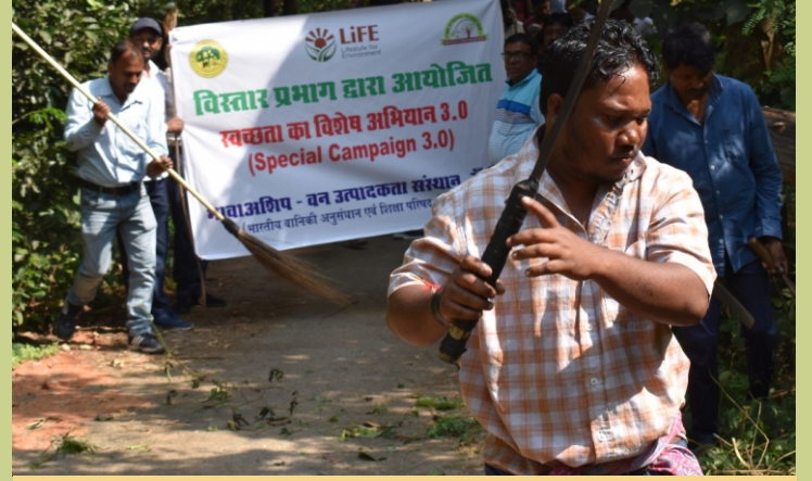
भा.वा.अ.शि.प.- व.उ.सं., रांची द्वारा आयोजित स्वच्छता अभियान