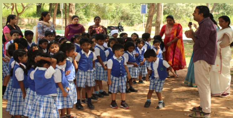
भा.वा.अ.शि.प.—व.जै.सं., हैदराबाद द्वारा मध्याह्न भोजन के माध्यम से आहार में मोटे अनाज (मिलटेस) शामिल करने के बारे में एक जागरूकता कार्यक्रम आयोजित किया गया