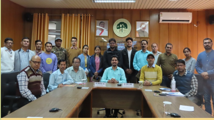
भा.वा.अ.शि.प., देहरादून ने एक विशेष हिंदी कार्यशाला का आयोजन किया