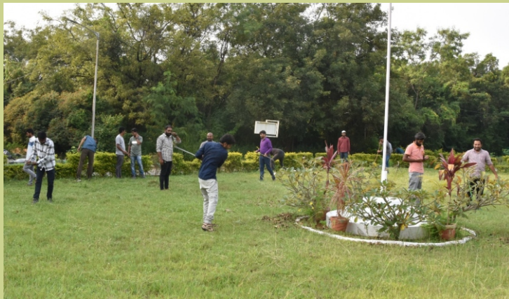
भा.वा.अ.शि.प.-व.जै.सं., हैदराबाद द्वारा स्वच्छता कार्यक्रम आयोजित किया गया