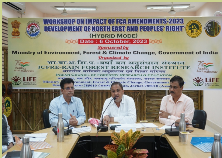
भा.वा.अ.शि.प.-व.व.अ.सं., जोरहाट द्वारा पूर्वोत्तर के विकास और लोगों के अधिकार पर एफसीए संशोधनों के प्रभाव पर एक कार्यशाला आयोजित की गई

नागालैंड वन विभाग, गैर सरकारी संगठनों, समुदाय आधारित संगठनों, ग्राम परिषद और शिक्षाविदों सहित 50 प्रतिभागी