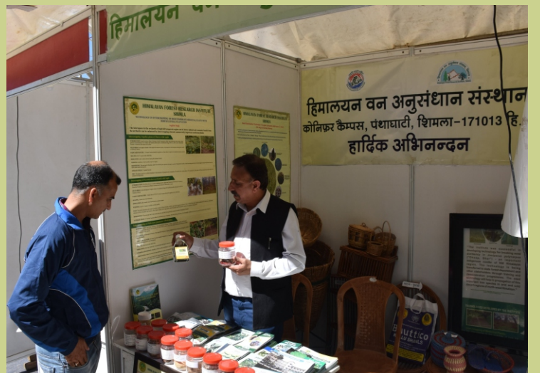
भा.वा.अ.शि.प.—हि.व.अ.सं. शिमला ने फ्लाइंग शिमला मेले की प्रदर्शनी में स्टॉल लगाया