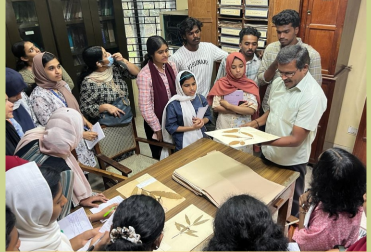
केरल के एमईएस पोन्नानी कॉलेज के वनस्पति विज्ञान विभाग के वनस्पति विज्ञान के यूजी के छात्रों ने भा.वा.अ.शि.प.-व.आ.वृ.प्र.सं., कोयंबटूर का दौरा किया