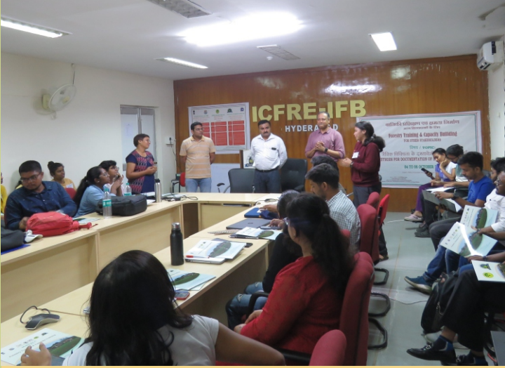
जैविक विविधता की प्रलेखन विधियाँ

गैर सरकारी संगठनों, पर्यावरणविदों और प्रगतिशील किसानों सहित 30 प्रतिभागी