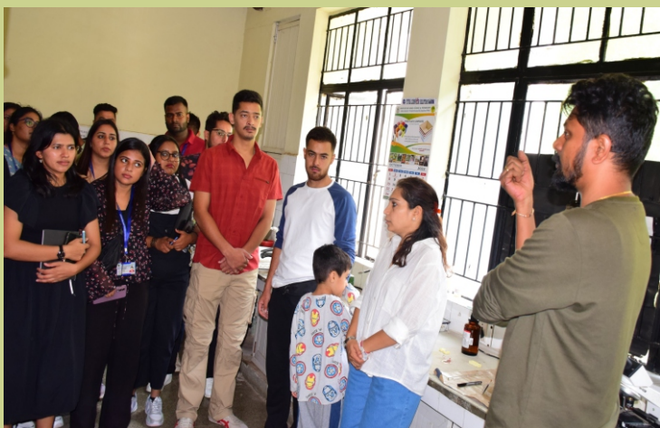
व.अ.सं. सम विश्वविद्यालय, देहरादून के संकाय सदस्यों के साथ एमएससी पर्यावरण विज्ञान के छात्रों ने भा.वा.अ.शि.प.-का.वि.प्रौ.सं., बेंगलुरु का दौरा किया