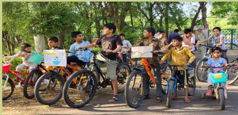
भा.वा.अ.शि.प.—शु.व.अ.सं., जोधपुर द्वारा बच्चों की साइकिल रैली आयोजित की गई