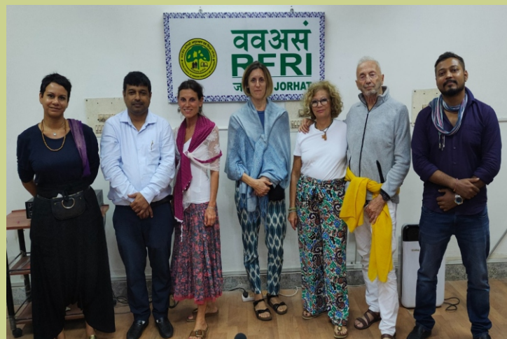
फ्रांस के विभिन्न इत्र उद्योगों के प्रतिनिधियों के समूह ने भा.वा.अ.शि.प.-व.व.अ.सं., जोरहाट का दौरा किया