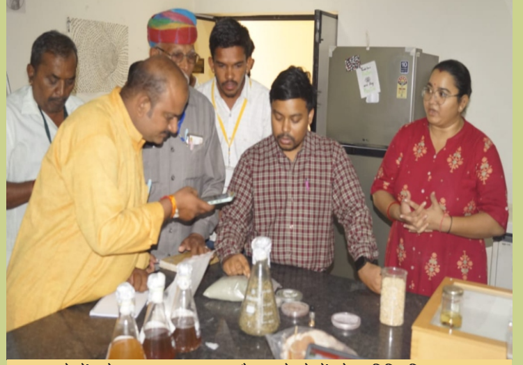
शुष्क क्षेत्रों को हरा-भरा बनाना और सूखे क्षेत्रों के पारिस्थितिक पहलू तथा सतत वानिकी पर संवेदीकरण