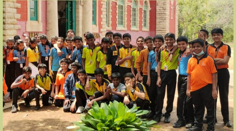
विभिन्न स्कूलों के छात्रों ने भा.वा.अ.शि.प.-व.आ.वृ.प्र.सं., कोयंबटूर का दौरा किया