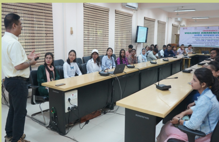
श्रीकिशन सारदा कॉलेज, हैलाकांडी के वनस्पति विज्ञान (ऑनर्स) के छात्रों ने भा.वा.अ.शि.प.-व.व.अ.सं., जोरहाट का दौरा किया