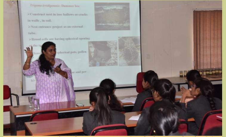
भा.वा.अ.शि.प.—व.जै.सं. हैदराबाद द्वारा मधुमक्खियों के महत्व और जैव विविधता संरक्षण में इनकी भूमिका पर एक प्रशिक्षण कार्यक्रम आयोजित किया गया।